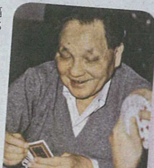
鄧小平出名鍾意打橋牌。

錦標賽六月七日至六月十六日喺香港富豪酒店舉行，分公開、女子及長青組等，各隊同時爭取九月世界錦標賽參賽資格。有橋牌迷同Kelly分析，中國、澳洲、印尼及台灣隊係傳統勁旅，但香港隊實力亦不容忽視，平均年齡雖不足三十歲，但牌技出眾，屬區內中游以上；女子隊則由香港、內地、英國裔及印度裔牌手組成，經驗豐富，屬黑馬之選。