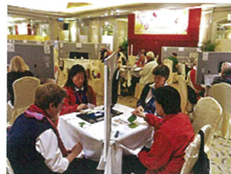
高手雲集: 參與第49屆亞太橋牌聯會錦標賽的「橋」壇好手雲集香港，勝出隊伍有機會參加9月在印尼舉行的世界錦標賽。