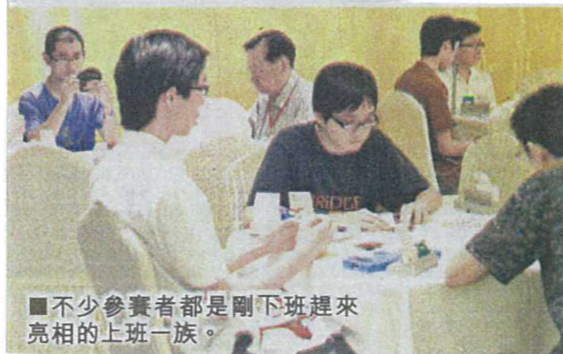
■不少參賽者都是剛下班趕來亮相的上班族。

洲、中華台北、澳門、印尼、香港、日本、馬來西亞、紐西蘭、菲律賓、新加坡及泰國；女子團體賽則有11隊亮相。是次比賽同時亦是世界橋聯第6區參加2013年世錦賽的選拔賽。