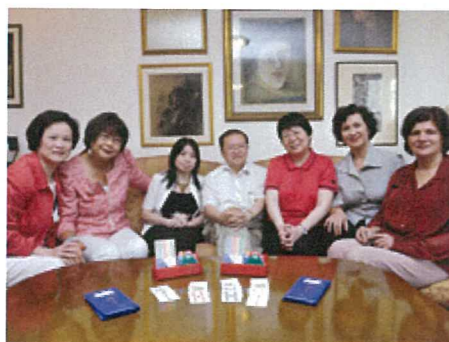
積極備戰: 第49屆亞太橋牌聯會錦標賽一連十日在香港舉行，香港女子代表隊六名成員和領隊（中）積極備戰。