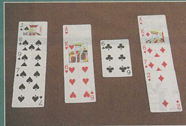
■每局莊家的隊友需開牌給其他人看，開牌時應將花色及大小排好。

第 49 屆亞太橋牌聯會錦標賽 日期：6 月 7 日至 6 月 16 日 地點：富豪香港酒店 參加國家或地區：澳洲、中國、香港、澳門、台灣、印尼、日本、南韓、馬來西亞、新西蘭、菲律賓、新加坡及泰國 網址： http://www.hkcba.org/apbf/2013/