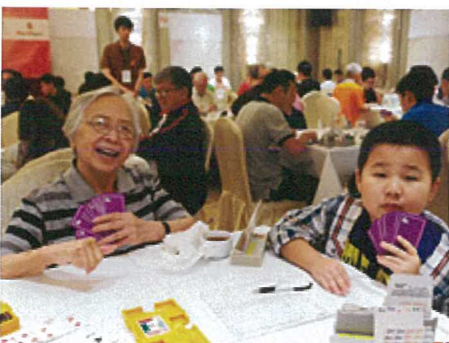
老少咸宜: 年僅九歲的橋牌「新星」和93歲經驗豐富的老婆婆，在橋牌桌上一較高下，成為一時佳話。