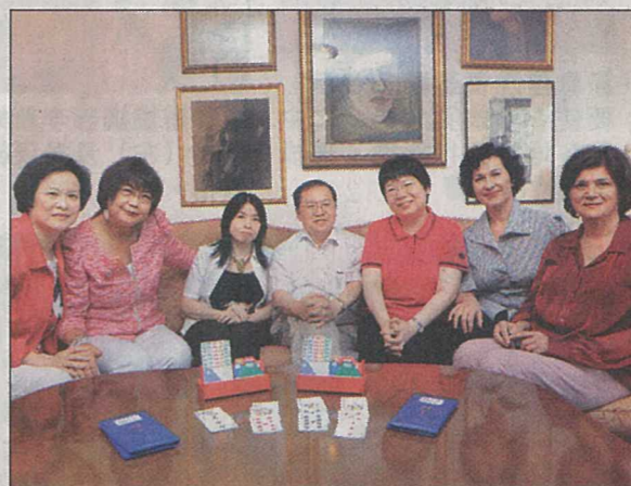
女子隊6名成員和領隊(中)積極備戰，爭取佳績。

橋牌有趣之處還包括「賽後檢討」環節。在大型橋牌賽事中，橋牌手可從賽後檢討，了解「高手」怎樣構