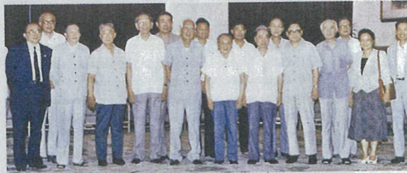
鄧小平（前排左六）與萬里（前排左五）參加橋牌邀請賽，與其他參加者合照。

鄧小平的橋牌水平之高，也是圈內高手的一致共識。世界女子橋牌冠軍美籍華人楊小燕曾與鄧小平打過四次橋牌，她對鄧小平的橋技讚不絕口，「鄧小平的牌技可不僅僅是業餘水平的，可夠得上專業水平了」。