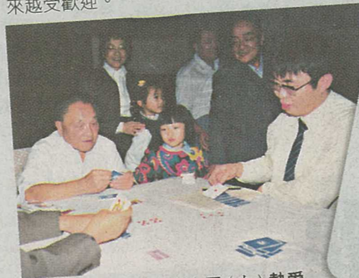
■ 已故中共領導人鄧小平(左)熱愛橋牌，右旁為著名圍棋大師聶衛平。

橋牌是已故中國領導人鄧小平、英國前首相邱吉爾及戴卓爾夫人、美國前總統艾森豪，還有印度聖雄甘地、微軟創辦人蓋茨及股神畢菲特等名人的共同興趣。前身是十八世紀時，於英國貴族流行的啤牌遊戲——惠斯特牌，玩法簡單，四人對打，每局每人有13張牌，每次每人出一張牌，牌大者獲下次出牌權，贏得最多為勝出者。至十九世紀末，惠斯特牌在土耳其漸變成橋牌，加入了雙倍及多倍等條款。1925年，美國人Harold Vanderbilt在芬蘭郵輪上發明了合約橋牌，增加叫牌制度，每局要估計自己最少勝出多少回合。1929年美國人Ely Culbertson創立世界首本橋牌雜誌《The Bridge World》，令這個考驗智慧與運氣的合約橋牌的規則更為完整，並且越來越受歡迎。