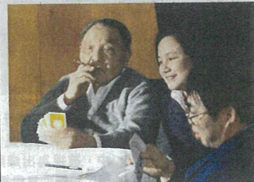
鄧小平打橋牌的水平曾獲得一些專業人士一致好評。（網上圖片）