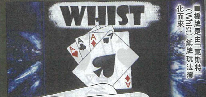
橋牌是由「惠斯特」(Whist)紙牌玩法演化而來。

20年後，美國橋牌名手范特比爾在「競叫式橋牌」基礎上創造了定約橋牌，規定只有叫成局並打成才算成局，同時增加了局況的因素，並取消了加倍和再加倍的無限性，只規定一次有效。橋牌的發展演化經歷了悠長的歷史，期間還出現許多分支，如盤式橋牌、三人橋牌等，但都由於種種原因沒有獲得更大的發展。