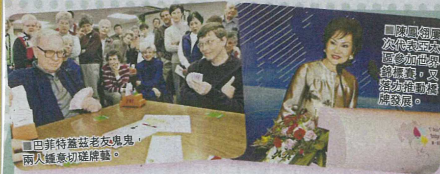
巴菲特蓋茲老友鬼鬼，兩人鍾意切磋牌藝。