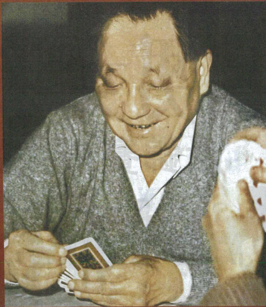
■鄧小平是橋牌高手，他打橋牌時的笑容給人留下了深刻的印象。