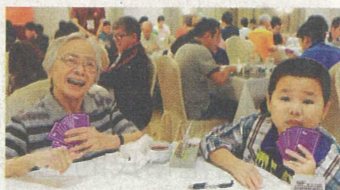
橋牌老少咸宜，圖為年僅9歲嘅橋牌「新星」同93歲經驗豐富嘅婆婆，喺桌上一較高下，而一眾橋牌好手近日就雲集香港參加錦標賽，爭取出戰世界賽資格。

組，至昨日為止嘅15隊中位列第四，若餘下賽事保持狀態，都有機會贏到參加世界賽資格。至於該組排第二嘅泰國隊伍，成員包括行會成員陳智思嘅泰國嘅家族成員。