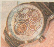
◆ 上圖：蔡國雄（右）同老友龍家祥（左）都係橋牌發燒友。左圖為蔡國雄設計嘅St. Gallen陀飛輪錶。